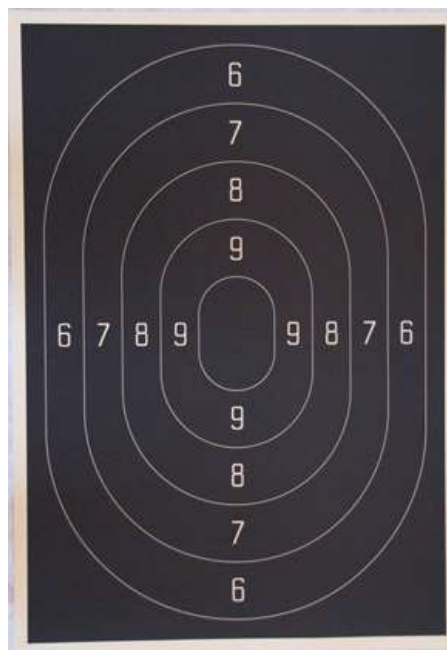
Afbeelding 2 Service Pistol klein kaliber

3.4.4.10 Ieder deelnemer start de wedstrijd op nieuwe schietschijven.