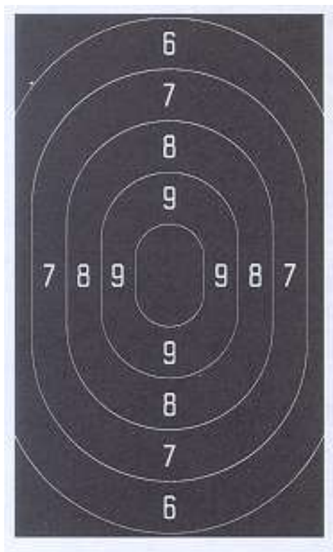
Afbeelding 1 Schijf Militair Pistool