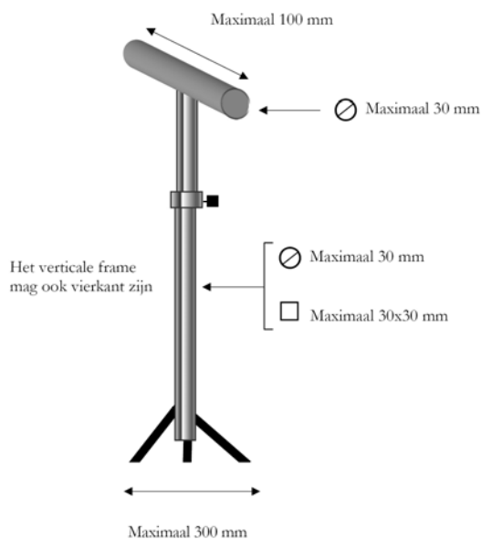
Afbeelding 1: Standaard voor opgelegd Pistool schieten