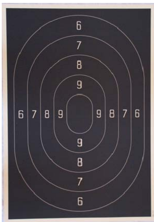
Afbeelding 2 Service Pistol klein kaliber