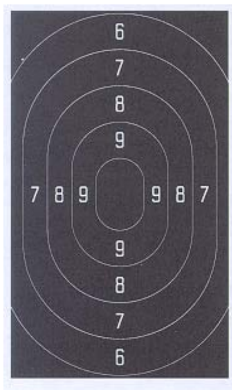
Afbeelding 1 Schijf Militair Pistool