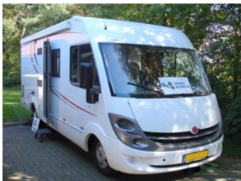
Het mobiele dopingcontrolestation

In die gevallen dat het niet mogelijk is een Dopingcontrole Station in te richten, beschikt de Dopingautoriteit over een Mobiel Dopingcontrole Station. Op initiatief van de Dopingautoriteit kan dit mobiele station ingezet worden.