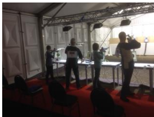
DTC Luchtgeweer N.W van Winden